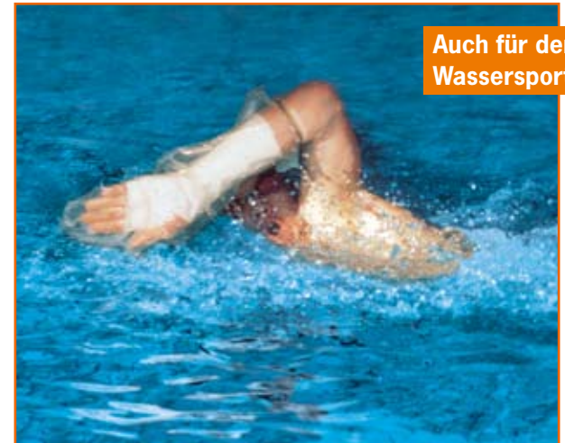
Auch für den Wassersport

Ob beim Schwimmen oder Tauchen – AquaProtect hält dicht.