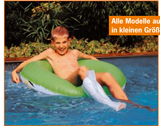
Alle Modelle auch in kleinen Größen.

AquaProtect schützt Arm- und Beinverbände nicht nur beim Duschen und Baden wirkungsvoll vor Wasser, sondern auch im Schwimmbad und beim Wassersport.